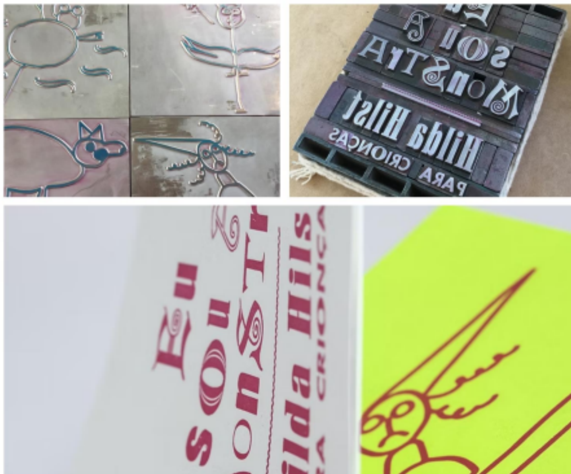
Figura 3 – Clichês, tipos móveis e exemplar do livro Eu Sou a Monstra: Hilda Hilst para crianças , projeto gráfico por Silvia Nastari.