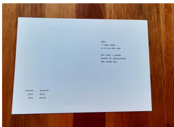
Imagem 5. Aline Dias e Diego Rayck, sem título – árvore , 2022-3, publicação de artista em processo, plaquete com 15x10cm.

Esta publicação integra um conjunto de poemas impressos nesta reduzida escala a partir da experiência de compor com a materialidade, o peso e a vagarosa temporalidade de uma oficina tipográfica, cujo impacto e ressonâncias serão abordadas futuramente em outro ensaio.