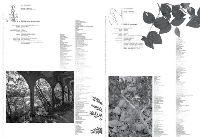
Imagem 3. Publicação invasoras (Garbelotti, 2021), verso das prachas 01 e 06.

A longa pilha de versos que acompanha as seis espécies estabelece um percurso com a planta. Minha percepção é de que cada planta, neste trabalho, propiciou um poema, referenciando a noção da poesia e do cinema como ofícios propiciatórios (Helder, 2019). Cada poema narra uma série de atravessamentos pautados na sua observação e tentativa de descrição, das experiências de encontro com as plantas in loco , nesta ilha desocupada sendo ocupada pelo projeto artístico mas também acionando memórias de suas ocupações prévias, relatos, usos e, notadamente, personagens, biografias e fragmentos de livros e filmes acionados na/pela minha atividade associativa de leitora-espectadora.