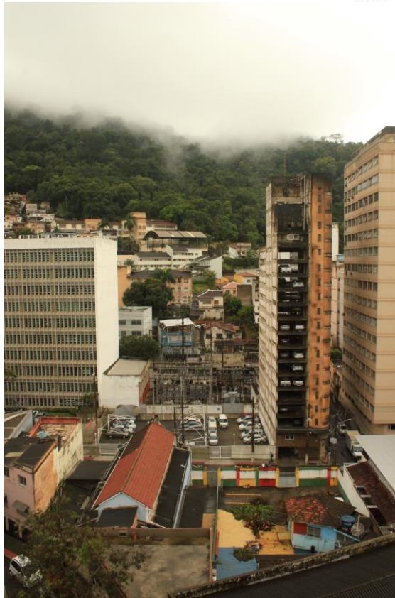
Imagem 6. Aline Dias. sem título – árvore , 2023, série fotográfica em processo.